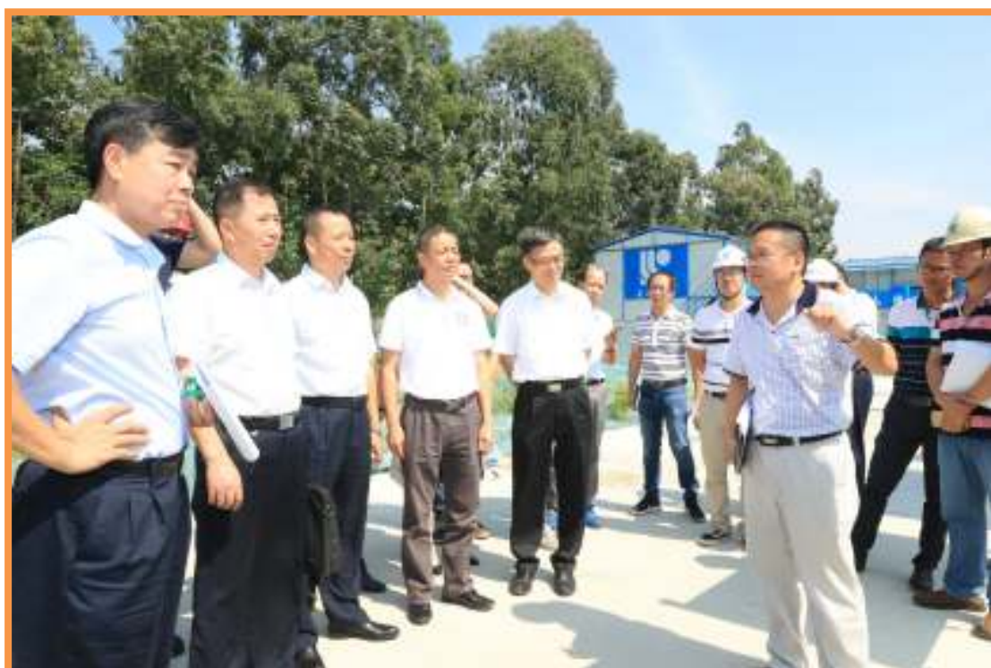
实地察看南沙区疾控中心建设工地现场。

12日 市政协提案委到南沙对市政协十三届一次会议第1056号提案《关于加快南沙区疾控中心建设的建议》办理工作开展回头看。实地察看南沙区疾控中心建设工地现场，南沙区疾控中心选址南沙区黄阁大道南侧特殊教育学校旁地块，项目总建筑面积10591.5平方米。