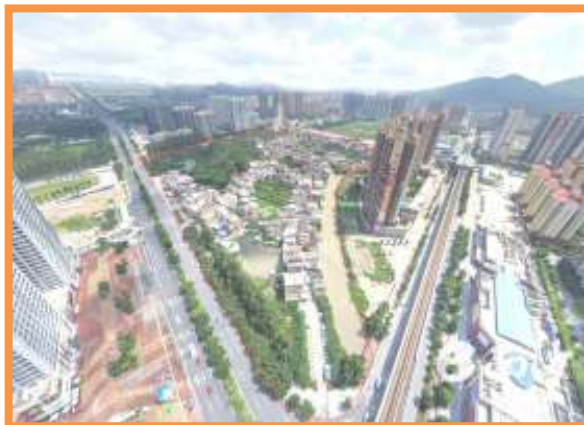
金洲、冲尾自然村位置图。

21日 南沙区首个旧村改造项目金洲、冲尾自然村更新改造在广州公共资源交易中心网站挂出公告，是广州市第一个通过市公共资源交易平台挂网招商的旧村改造项目。金洲、冲尾自然村位于南沙自贸试验区蕉门河中心区中部，隶属于南沙街金洲行政村，该地区现状以村庄居住、农田鱼塘用地为主，规划研究范围 18.05 公顷，改造范围总用地面积约为 15.15 公顷。现状建设用地 9.68 公顷，现状建筑总量 13.03 万平方米，共 556 栋，常住人口 1183 人，约 349 户。